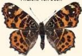
Frühlingsgeneration Ansicht von oben